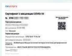
Распечатка сертификата вакцинации (либо его предоставление в электронном виде)

2 Сотрудникам организации для допуска посетителей в организацию (разрешения в обслуживании) требуется организовать проверку у посетителей документов, указанных в пункте 1