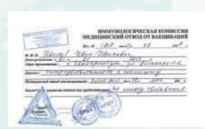
Справка с медотводом