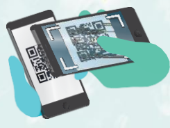
Распечатка фото QR-кода (либо его предоставление в электронном виде)